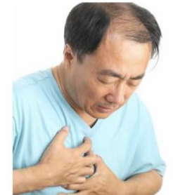
قلب درد یا درد قفسه سینه دارید. بازوی چپ شما بی‌حس شده است. نمی‌توانید تنفس کنید.