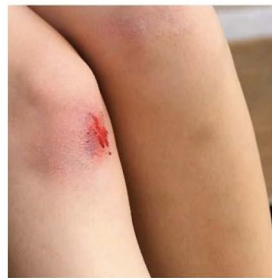
آبریدگی کوچکی در بدن خود دارید. راه‌حل: یک چسب زخم بالای آن بزنید.

نزدیک‌ترین ایمرجنسی به جایی که من زندگی می‌کنم... نام: _____ آدرس: _____