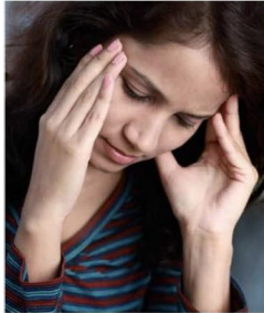
کمی سردردی دارید. راه‌حل: تابلت مسکن بخورید.

نزدیک‌ترین شفاخانه به جایی که من زندگی... نام: _____ آدرس: _____