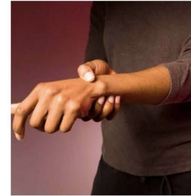
ایک استخوان شما می‌ده شده است.