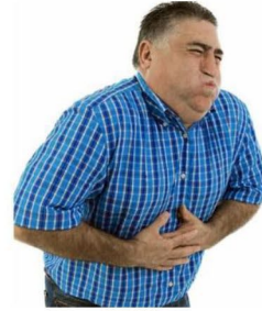
روزهای زیادی احساس حالت تهوع می‌کنید.