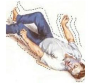
شخصی تشنج می‌کند.

نزدیک‌ترین ایمرجنسی به جایی که من زندگی می‌کنم... نام: _____ آدرس: _____