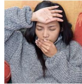
شما به مدت 2 روز یا بیشتر تب دارید.