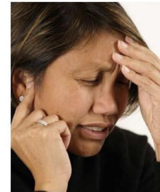
مدت زیادی است که گوش‌درد شدید یا سردردی دارید.