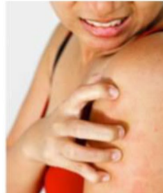
ایک جوش کوچک دارید که از بین نمی‌رود.