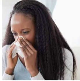
آبریزش بینی یا سرماخوردگی دارید.

نام: _____ آدرس: _____ نمبر تلفون: _____